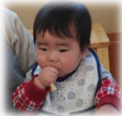
パク!もぐもぐ! おいしいね。