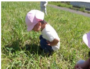
○てんとう虫いるかなあ