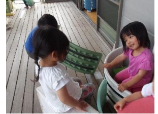
○「いらっしゃいませ！」

・室内ではじっくりと遊ぶ事を大切に。一人でじっくりと遊ぶところから始まり少しずつ友達との関わりに繋がっていきます。遊びの中で想像力が豊かになり相手の思いにも気づけるように。そばで見守りながら「出来たね！」と気持ちを共感することも大切です。遊びを終える時には片付けて、区切りを付けてから次の遊びに移れるよう見守っていききたいと思います。