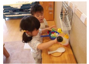
○マヨネーズも入れよう