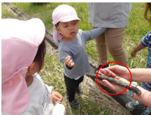
○セミの幼虫を発見！