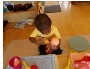
○赤ちゃんミルクどうぞ