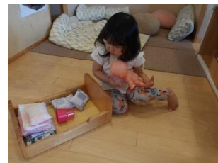
○自分で布団を畳めたよ